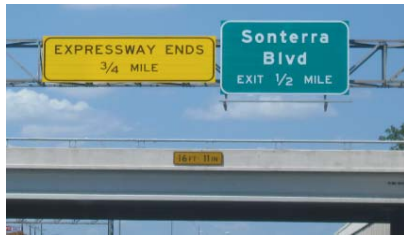
US 281 al norte de Loop 1604 es una carretera dividida de seis carriles y luego una carretera dividida de cuatro carriles con semáforos.

La primera reunión pública para detectar y explorar las necesidades en agosto de 2009 se enfocó en las necesidades y el propósito de los mejoramientos dentro del corredor de US 281. En la primera reunión, se le preguntó a nuestra comunidad, "¿A cuáles necesidades se debe dirigir y cuales opciones de transporte cumplirán mejor con sus necesidades dentro del corredor de US 281?" Basándose en los comentarios expresados por el público, las agencias gubernamentales, y el Comité Asesor de la Comunidad, una colección de cuatro propósitos, distintos pero relacionados, fueron determinados para los mejoramientos dentro del corredor de US 281. Cualquier mejoramiento en el corredor de US 281 debe: